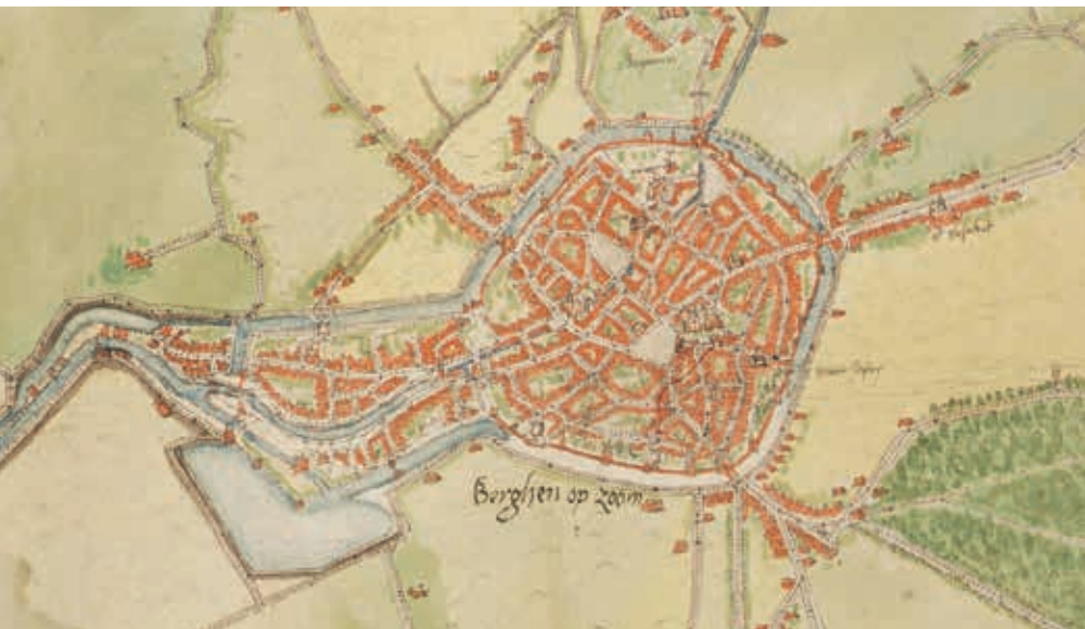
Kaart van Bergen op Zoom (Jacob van Deventer, ca. 1545)