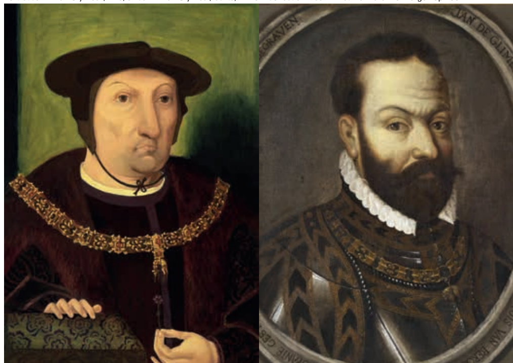
Portret Jan III van Glymes (links) en Jan IV van Glymes (rechts).

kg per persoon per jaar – ruimschoots meer dan de hoeveelheid die nodig was om op te overleven. Verder was er waarschijnlijk ruim voldoende geld voor groenten – in de vorm van de middeleeuwse potagie , een soep op basis van groenten en wellicht wat goedkoop vlees. Met het budget voor potagie kon aan iedere bewoner bijvoorbeeld 63 kilo erwten per jaar worden verstrekt, wat ruim boven de norm van het boodschappenmandje ligt en hetzelfde geldt voor de 3,8 kilo vlees die kon worden gekocht tijdens Christelijke feestdagen. Wat kleding betreft kwamen de bewoners er wellicht wat kariger vanaf met 2,4 meter textiel, waar het boodschappenmandje uitgaat van 3 meter – al dient daarbij worden aangetekend dat de bewoners van Sint-Janshuis wél ieder jaar nieuwe schoenen ontvingen. De hoeveelheid zeep, waarmee het beddengoed werd gewassen, lijkt ook overeen te komen met het minimale dat vereist was. Tenslotte was er de brandstof waarmee de oudjes hun kamer konden verwarmen: de geleverde hoeveelheid turf lijkt voldoende geweest te zijn. Voor boter, kaarsen, of lampolie had de stichter geen voorzieningen getroffen.