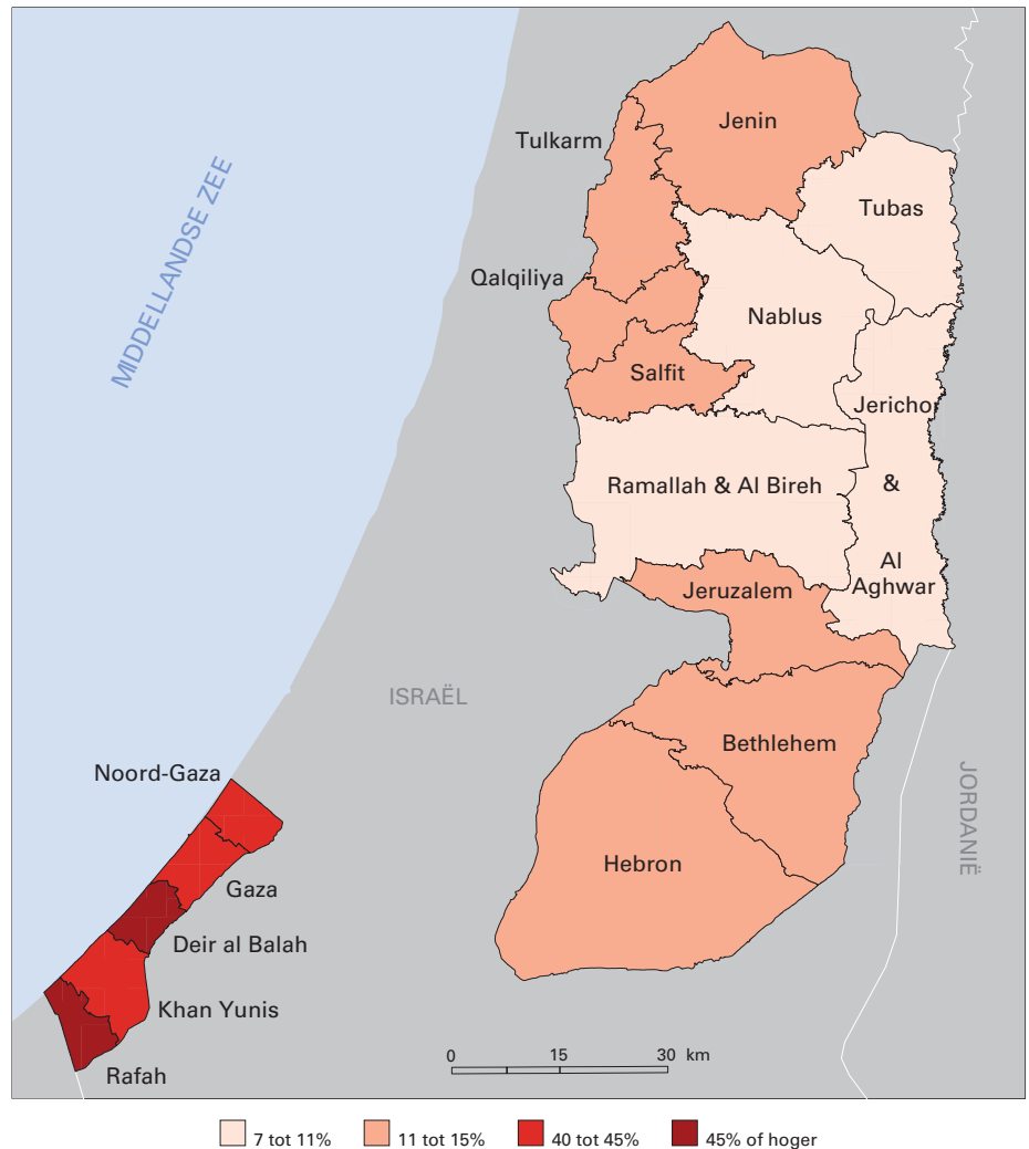
Figuur 2. Het werkloosheidspercentage per gouvernement, Palestina, 2017

Bron: Groenewold en van Wissen (2020); kartografie: Peter Ekamper/NIDI.